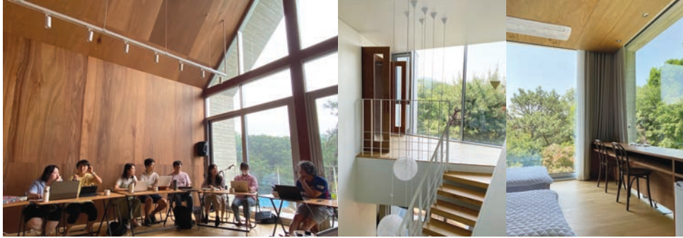
3F 301호 막달라 마리아 (침대 2인실) / 302호 유니아 (침대 2인실) / 303호 뵤뵤 (침대 2인실) 예배실 - 마리아의 집 / 다락방