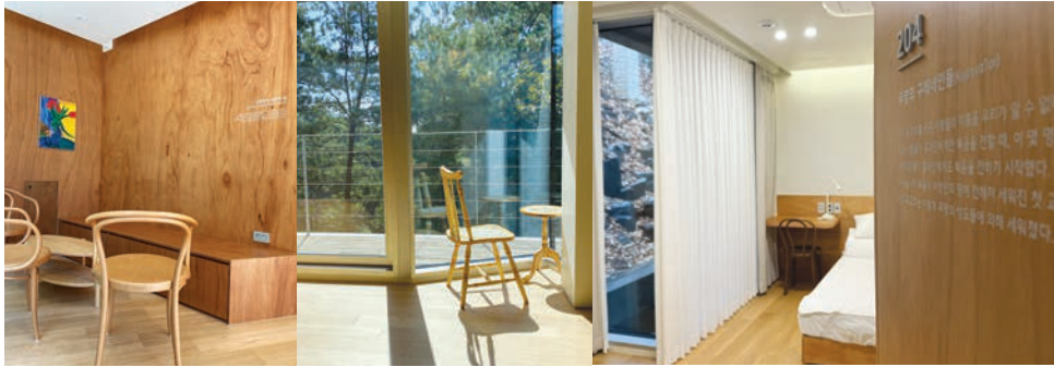
2F 201호 아리스타고 (다인실-4인) / 202호 두기고 (다인실-4인) 203호 무명의 구브로인들 (침대 2인실) / 204호 무명의 구레네인들 (침대 2인실) 나병환자 시몬의 집 (공유공간)