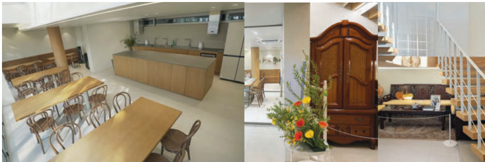
1F 가이오 식당 (이용 인원-24명) / 101호 브리스길라와 아글라 (다인실-6인)

식당 비치품 : 식기류, 그릇, 머그잔, 냄비, 후라이팬, 압력밥솥 2개, 냉장고, 와인셀러, 와인잔, 오븐, 전자레인지, 정수기, 전기포트, 토스터기 2개, 커피그라인더, 드리퍼 / 객실 비치품 : 샴푸, 바디워시, 수건, 드라이기, 전기포트, 소형냉장고