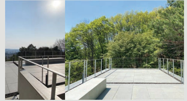
야외 기도 장소 1 : 뵤뵤 (진.공.관 옥상)