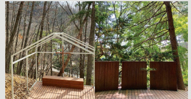
야외 기도 장소 2 : 겐세마네 / 야외 기도 장소 3 : 감람산

입실시간 : 3시 / 퇴실시간 : 11시 / 애완동물 동반 금지 / 최대 이용 인원 30명 / 주차공간 8대